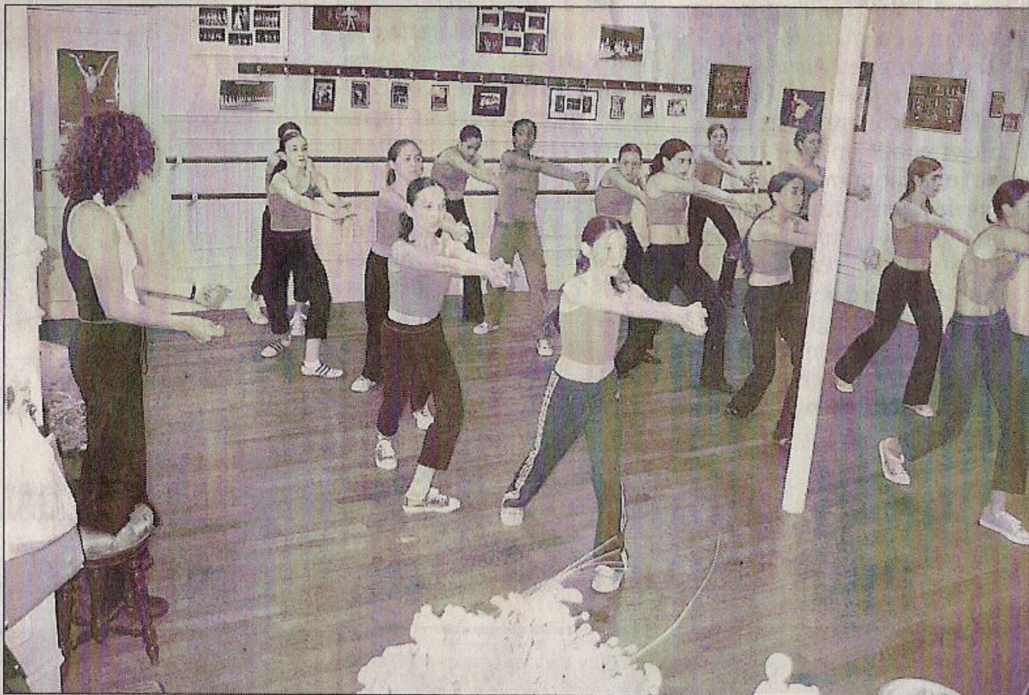
Un réel plaisir à danser, un véritable bonheur à regarder.